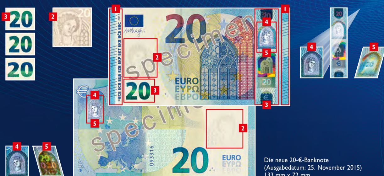
Die neue 20-€-Banknote (Ausgabedatum: 25. November 2015) 133 mm x 72 mm